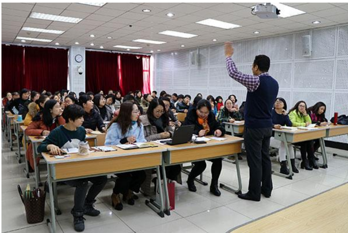
俞爱宗教授工作坊现场

为有效提升我校教师的教学科研能力和研究水平，服务学校教学改革、开展教学研究、总结推广教学成果，11月23日，教师教学发展中心、教务处、高等教育发展战略研究所共同邀请延边大学师范学院院长俞爱宗教授来我校举办“高校教学研究的选题与课题设计”教学工作坊专题活动。各教学单位及兄弟院校共80余位教师参加。