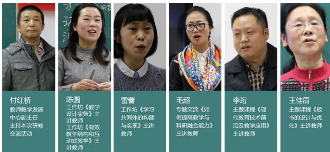
重庆大学教师教学发展中心主讲团队

果，理论联系实际，详细介绍了在创新思路指导下的具体教改行动，包括对建筑专业学科结合信息技术建立 BIM 平台的思考、VR（虚拟现实）与 AR（增强现实）技术的应用、面向建筑工业化全过程的新信息技术的教学实验、搭建土木建筑大领域学生平台等内容。在场参加研修老师认真学习讲座内容，进一步开阔了学术视野。