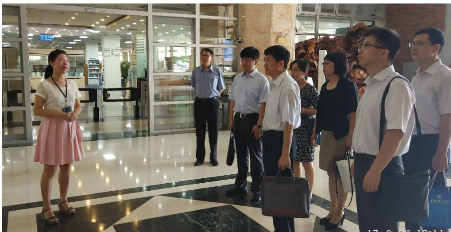
参观朝阳科技大学图书馆

访问朝阳科技大学期间，代表团参观了该校图书馆、研究中心，走访了有关教师培训部门，聆听了“教学品质保障”和“台湾高等职业教育现状与分析”两场报告，就教师培训项目开展、教师学术交流等方面与对方学校进行了深入交流。