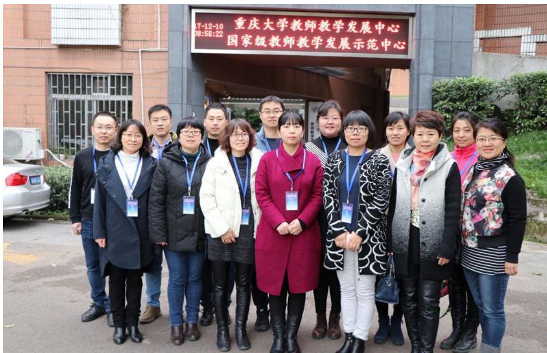
研修交流合影留念

为有效提升我校骨干教师的教學能力，更好地理解“以學為中心”的現代教育教學理念，掌握教學設計、教學實施等方面的基本原理解和方法技能；體驗利用現代教育技術開展線上學習及其在課堂教學、評估反饋等多環節的作用和效果，12月10日至12日，我校與吉林大學、吉林農業大學、吉林財經大學4所高校共計45名骨幹教師，赴國家級教師教學發展中心—重慶大學教師教學發展中心開展“教師專業成長——成為從A到A+的教師”教學研修培訓和交流。我校共有14名骨幹教師參加學習。