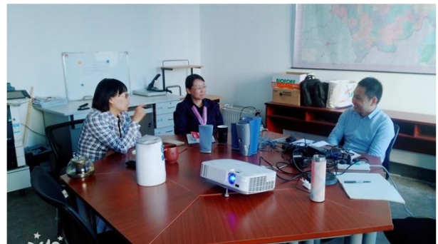
学习“教学PPT如何设计更精彩—吴军其”