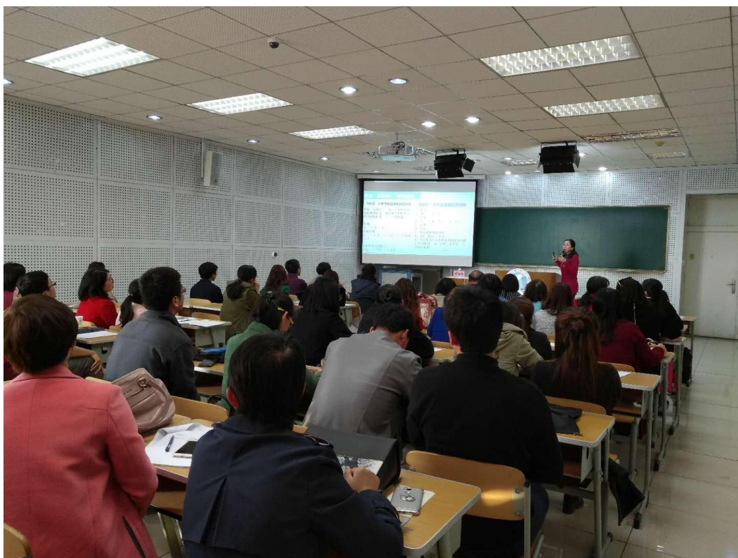
靳淑梅工作坊现场（一）

为促进我校教师综合素养和教学能力的提升，10月12日，教师教学发展中心邀请延边大学师范学院靳淑梅教授开展主题为“大班课堂的有效教学组织”教学工作坊专题活动。各教学单位共70余位教师参加。