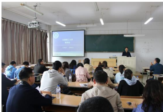
本科教学规范报告