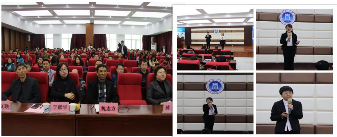
教师风采展示活动现场

在不平凡时期，近期国家的一系列政策，多次提到本科教学和课程建设，推出一系列措施方法，对打造“金课”提出要求。我校正在出台打造“金课”实施方案。说课是打造“金课”的必经之路，每位教师都应该反思自身的本科教学效果，努力达到教学目标，这是一场教学观念的转变，大家要努力奋斗，打造优秀课堂；大家要努力引领本科教学，不断提升教学质量。