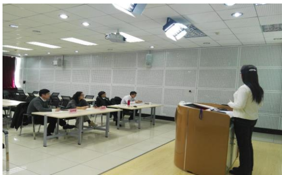
外校专家点评现场

5位参赛教师通过15分钟的说课，展示了课堂教学能力。2位专家认真听取记录，针对每一位教师提出了建议和意见。