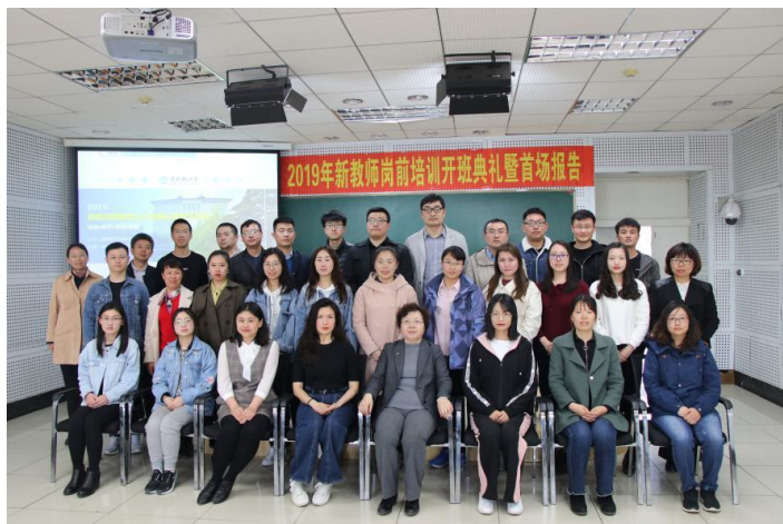
全体参会人员合影

本次岗前培训历时6周，通过专题报告、教学工作坊、教学实践演练、教学观摩与示范等形式，重点突出如何做好科学研究和获得教学技能，旨在帮助新教师消除疑惑点、增加兴奋点，为他们走上教学科研岗位打下坚实基础。