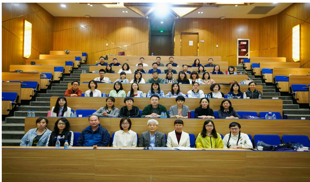
参训教师与席酉民教授合影