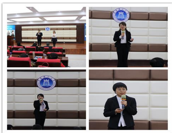
获奖教师现场展示