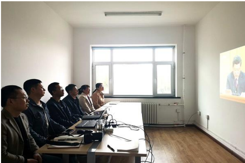
中心人员收看大会直播

大会结束后，中心人员纷纷表示，下一步要将大会精神贯彻落实到对教师培训、服务，中心建设等各项工作中去，履行好中心使命，不断提高工作的质量和水平。