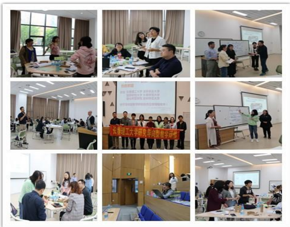
授课中老师们积极发言

为期三天的研修活动很快落下帷幕，“以学生为导向”的研究导向型教学给老师提供了新的教学理念和教学策略。参训教师通过从理论层次的研讨到团队合作实践的结合，充分认识到课堂教学是教师引导学生探究的过程，教学目标不仅仅是教师教给学生知识和技能，更是帮助学生建构新知，进而启发学生探究未知的能力。