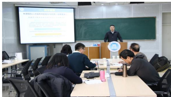
学院同行点评现场

5位参赛教师根据之前培训的内容，结合自身的学科特点，融合说课的方法和技巧，轮流进行现场说课展示，点评专家依次进行指导和建议。5位教师分别进行了15分钟的说课，从教材分析到学情分析，教学目标制定到重难点的把握，教法学法的选择到教学流程的预设，课程设想到课件使用。专家们认真听取记录，针对每一位教师提出了自己的见解，肯定说课参赛教师的长处，指出了不足，帮助参赛教师明确了接下来需要进一步完善的方向和思路。